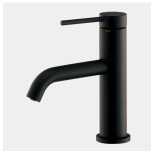
183-221-D シングルレバー混合栓